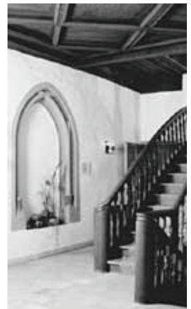
RPZ in der Alten Abtei Heilsbronn