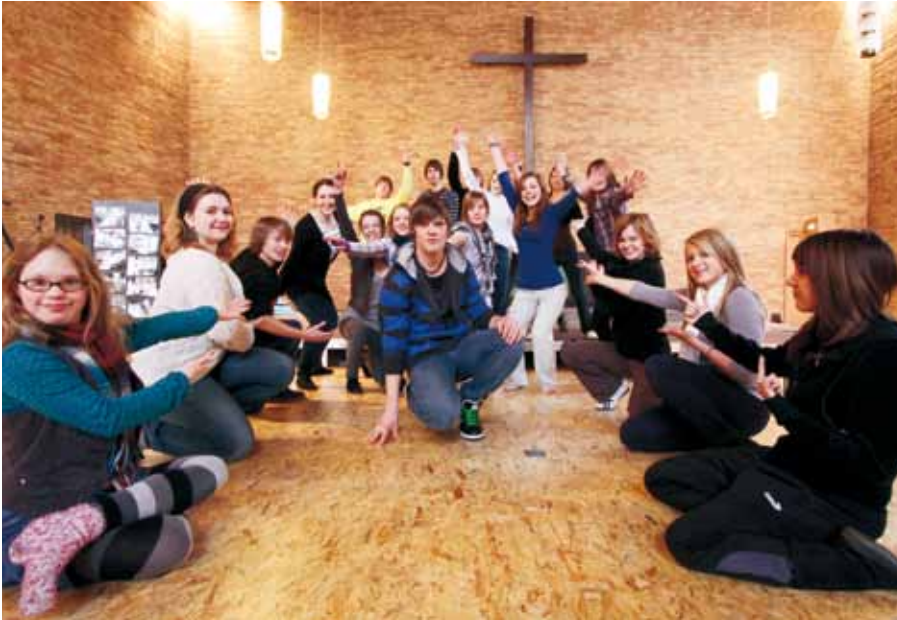
Ein Paradies zum Mitmachen: In Bremen wird am 27.02.2010 Nordwestdeutschlands erste Jugendkirche „Garten Eden 2.0“ eröffnet.

kam es aus Anlass zusätzlicher steuerlicher Belastungen immer wieder zu verstärkten Kirchenaustritten. Auch der Zuzug nichtchristlicher Ausländer wirkte sich auf den Anteil der Mitglieder christlicher Kirchen an der Bevölkerung aus. Heute sind in Westdeutschland 72 Prozent der Wohnbevölkerung Mitglied einer christlichen Kirche. In Ostdeutschland sind es nur noch 25 Prozent. Im gesamtdeutschen Durchschnitt ergibt das 63 Prozent.