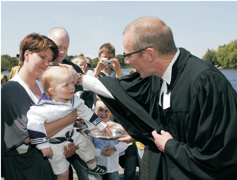
Taufe mit Wasser aus der Außenster in Hamburg

Im Jahr 2009 wurden in Deutschland 199 000 Menschen evangelisch getauft. In der Tradition der Volkskirche wird die Taufe in den meisten Fällen im ersten Lebensjahr vollzogen. Kinder, deren Eltern beide einer christlichen Kirche angehören, werden auch heute noch fast ausnahmslos getauft. Man-