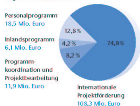
EED-Haushalt nach Hauptaufgaben 2003 insgesamt 144,8 Mio. Euro

Der EED stellt 2003 für die internationale Projektförderung 74,8 Prozent und für das Personalprogramm 12,8 Prozent der Haushaltsmittel bereit. Für die entwicklungsbezogene Förderung in Deutschland und die Lobby- und Öffentlichkeitsarbeit des EED werden 4,2 Prozent und für die Programmkoordination und Projektbearbeitung 8,2 Prozent verwendet.