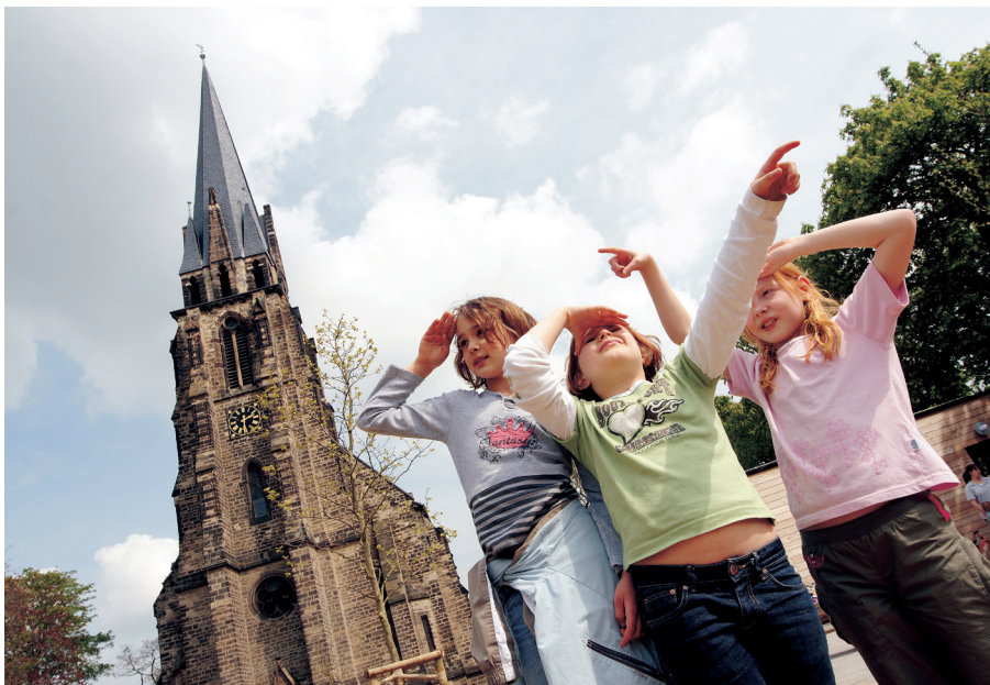
Kinder spielen auf dem Spielplatz am Martinszentrum in Bernburg.

Volkskirchliche Strukturen haben sich trotz der unterschiedlichen Entwicklung bis heute überall erhalten: Kinder christlicher Eltern werden in der Regel weiterhin durch die Taufe im ersten Lebensjahr in die Kirche „hineingeboren“. Insbesondere die Mitwirkung im Bildungs- und Erziehungswesen sowie im kulturellen und sozialen Bereich dokumentiert die öffentliche Bedeutung der Kirchen. Das Leitbild einer christlichen Sozialethik ist nach wie vor für die Gesellschaft bedeutsam ■