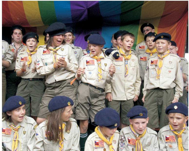
Bundeslager des Verbandes Christlicher Pfadfinderinnen und Pfadfinder in Großerlang bei Rheinsberg

(Ilse Junkermann, Landesbischöfin der Evangelischen Kirche in Mitteldeutschland)