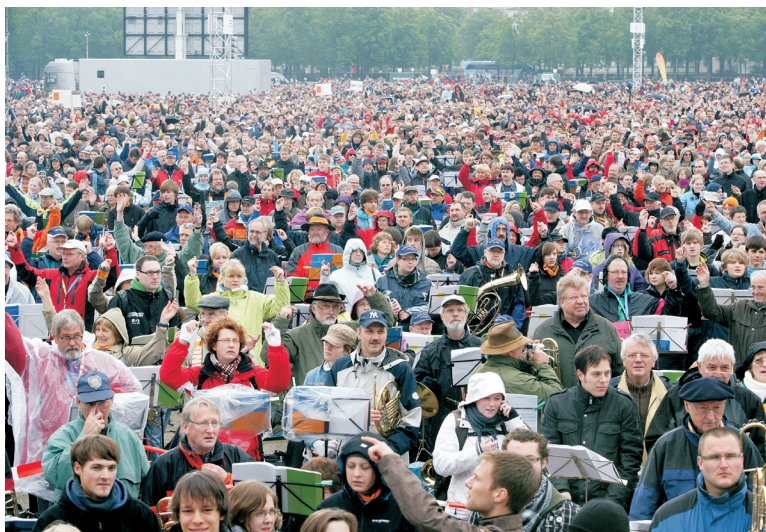
Abschlussgottesdienst beim 2. Ökumenischen Kirchentag in München 2010

Die Teilnahme am Gemeindegottesdienst ist ein wesentlicher Ausdruck christlicher Frömmigkeit. Im Laufe eines Jahres werden in Deutschland an Sonn- und Feiertagen 1,2 Millionen Gottesdienste gefeiert, darunter sind etwa 260 000 Kindergottesdienste. Das sind pro Sonn- und Feiertag