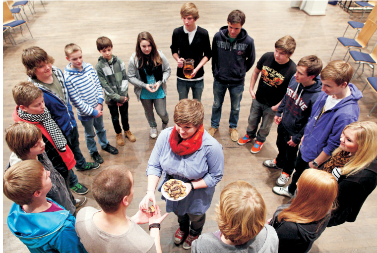
Abendmahl bei einem „Nightchurch“-Jugendgottesdienst in Düsseldorf 2011

der ganzen Familie gemeinsam am Gottesdienst teilzunehmen, findet großen Zuspruch bei Eltern mit Kindern, die sonst eher selten in der Kirche anzutreffen sind. In den westdeutschen Gliedkirchen ist die Zahl der Familiengottesdienste zwischen 1987 und 2009 von 39 000 auf 58 000 gestiegen. Auch in den östlichen Gliedkirchen haben sie ihren festen Platz im Gemeindeleben. Acht Prozent der sonntäglichen Gottesdienste feiern Eltern und Kinder dort gemeinsam.