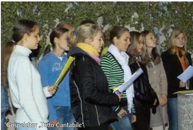
Gospelchor „Tutto Cantabile“

Nach diesem Programmblock sind alle deutschen und ausländischen Mitbürger eingeladen, bei kulinarischen Angeboten aus vielen Nationen die Wochen in gemütlicher Runde ausklingen zu lassen.