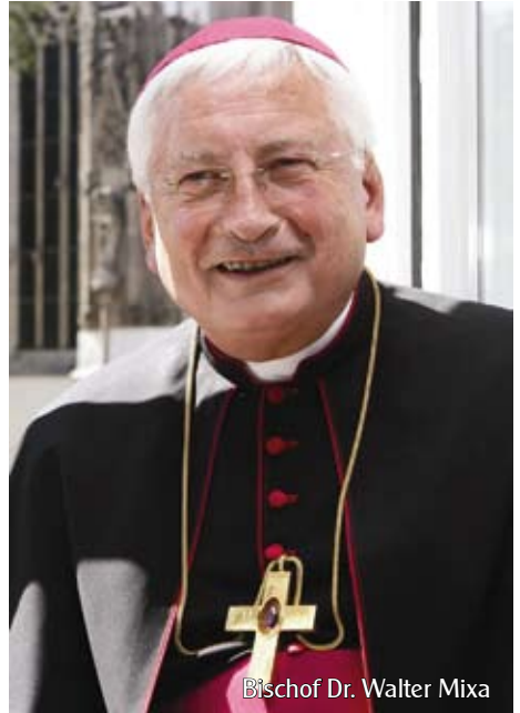
Bischof Dr. Walter Mixa