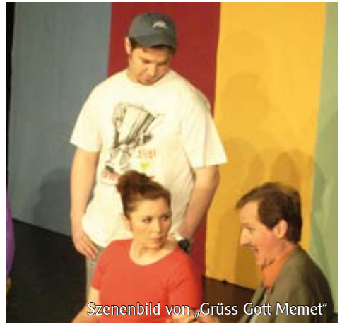
Szenenbild von „Grüss Gott Memet“

Es wendet sich sowohl an türkische als auch an deutsche Zuschauer.