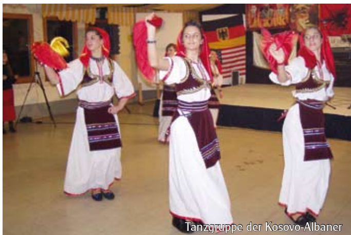
Tanzgruppe der Kosovo-Albaner

Dabei stellen sich verschiedene Migrantenfamilien aus mehreren Ländern vor: