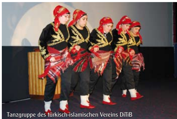
Tanzgruppe des türkisch-islamischen Vereins DiTiB

Die Familien erzählen den Besuchern aus ihrer Lebensgeschichte, ihrer Kultur und ihrer persönlichen Situation und beantworten Fragen. Parallel dazu gibt es ein buntes Kulturprogramm mit Unterhaltung, Musik, Tanz und kulinarischen Angeboten.