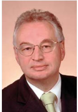
Dr. Rainer Oechslen Beauftragter für interreligiösen Dialog der Evang.-Luther. Kirche in Bayern