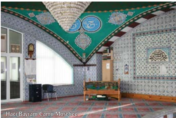
Haci Bayram Camii Moschee

Die Kosten für die Busfahrt betragen 6 Euro pro Person. Anmeldung und nähere Informationen bei der Geschäftsstelle der Katholischen Erwachsenenbildung, Tel: 08441/6815.