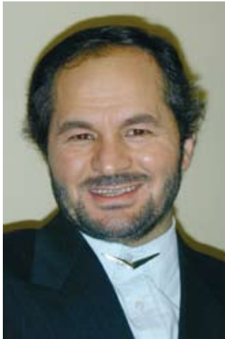
Bekir Alboga Islamwissenschaftler und Leiter des Koordinierungsrates der Muslime in Deutschland