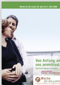
Ankündigungsplakat DIN A4