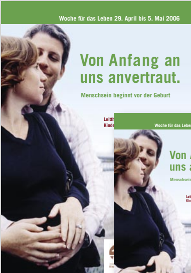
Motivplakat DIN A1