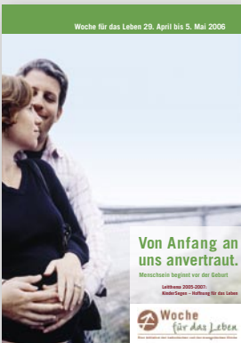
Ankündigungsplakat DIN A3