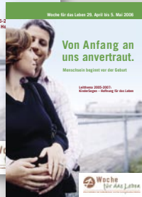
Motivplakat DIN A4