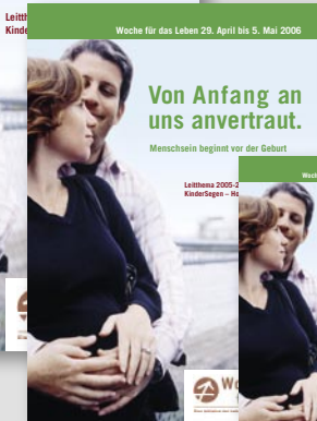
Motivplakat DIN A3