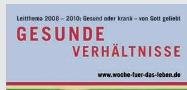
Motivplakat DIN A1