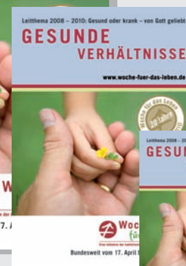
Motivplakat DIN A3