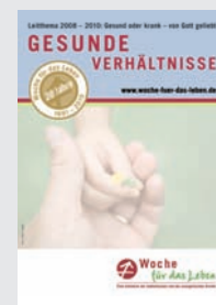
Ankündigungsplakat DIN A4