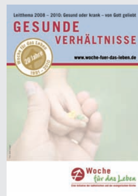
Ankündigungsplakat DIN A3