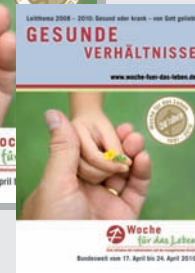
Motivplakat DIN A4