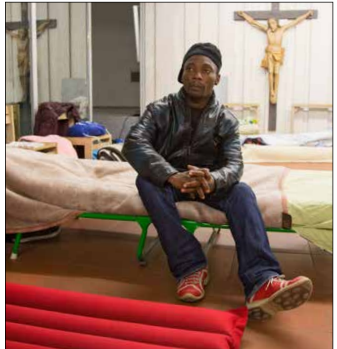
Flüchtling im Kirchenasyl in Frankfurt am Main

Bundesinnenminister Thomas de Maizière hat den Kirchen vorgeworfen, sich mit ihrer Praxis des Kirchenasyls über geltendes Recht zu stellen und die Dublin-Regel im europäischen Recht auszuhebeln. Der CDU-Politiker zog Anfang Februar einen Vergleich zwischen dem Kirchenasyl und der islamischen Scharia, die als „eine Art Gesetz für Muslime“ auch nicht über deutschen Gesetzen stehen dürfe. Die Evangelische Kirche in Deutschland (EKD) wies diese Argumentation zurück. Der Innenminister nahm den Vergleich später zurück.